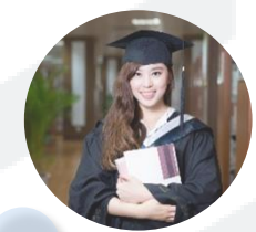
14 Студенты очной формы

13 Не работающие получатели государственной адресной социальной помощи