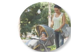
2 Не работающие, воспитывающие детей до 3-х лет

3 Находящиеся в отпусках по беременности (родам), усыновлением (удочерением) новорожденного ребенка (детей), по уходу за ребенком (детьми) до достижения им (ими) возраста трех лет